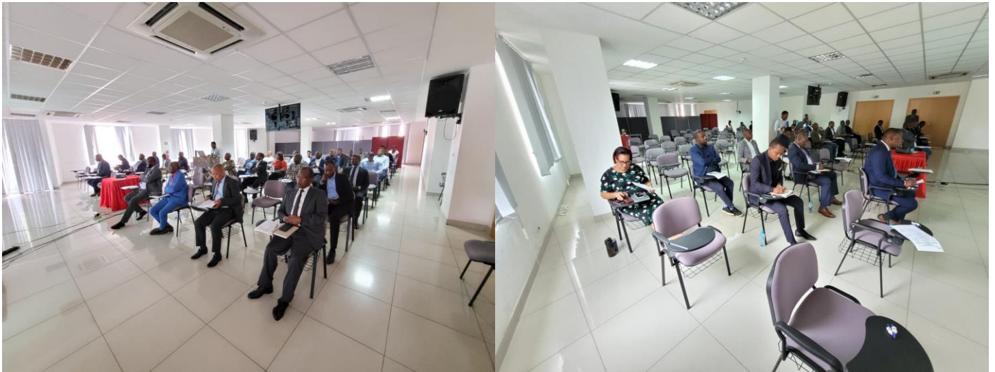
Participantes ao encontro: convidados de diversas instituições, Directores Nacionais, Directores Adjuntos, chefes de departamentos, consultores do PIU e técnicos de diferentes orgânicas do INE.