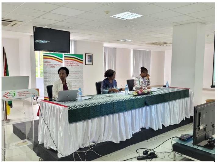
A presidente do INE no centro, ladeada á esquerda pela Directora Nacional de Integração, Coordenação e Relações Externas e a direita pela Coordenadora da Unidade de Implementação do