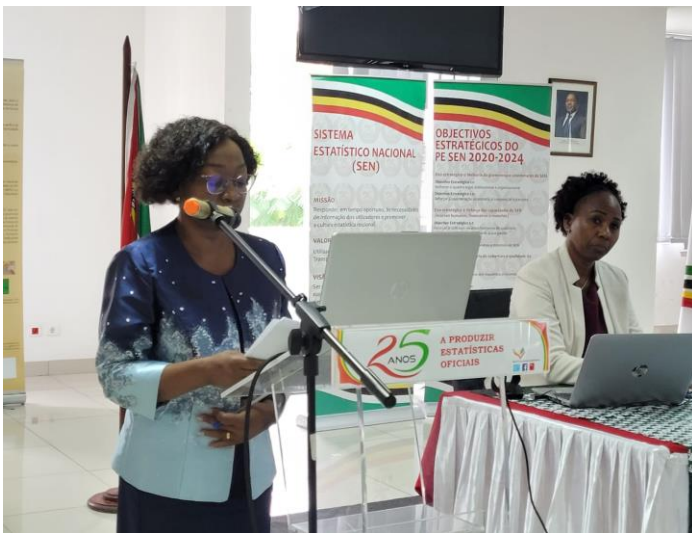
Discurso da abertura proferido pela presidente do Instituto Nacional de Estatística