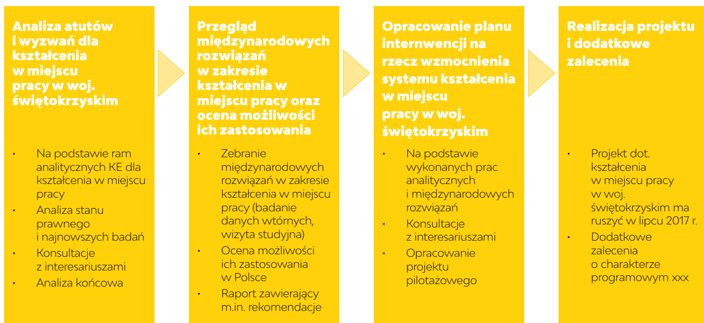
Rys. 1. Przebieg działań w ramach inicjatywy „Catching-Up Regions”

Analizę silnych i słabych stron kształcenia w miejscu pracy w woj. świętokrzyskim przeprowadzono na zgodnie z ramowymi założeniami dokumentu Komisji Europejskiej z 2015 pt. „Dwadzieścia wskazówek dla wysokiej jakości praktyk zawodowych i kształcenia w miejscu pracy”. 5 Analiza polegała na przeglądzie przepisów i literatury przedmiotu, a także szerokich konsultacjach z kluczowymi interesariuszami, w tym z placówkami oświatowymi prowadzącymi kształcenie i szkolenie zawodowe, przedsiębiorstwami oraz funkcjonariuszami publicznymi lokalnego, regionalnego i centralnego szczebla. W rezultacie zidentyfikowano sześć „kluczowych aspektów” będących wyzwaniem dla wdrożenia kształcenia w miejscu pracy w woj. świętokrzyskim. Są to: